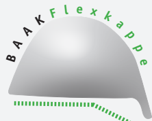
Fußgerecht statt gerade

zusammen ermöglichen ein natürliches Abknicken der Füße in Sicherheitsschuhen.