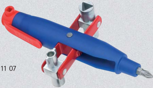
00 11 07