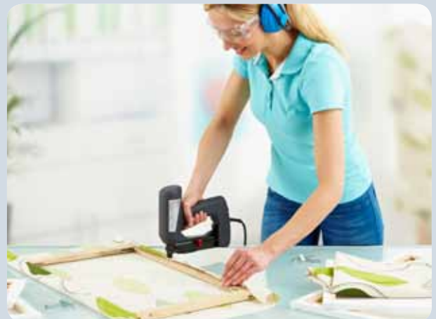
Schnelles Bespannen von Bilderrahmen.