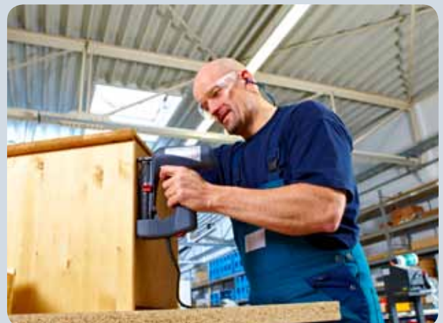
Schnelles Nageln von z.B. Möbelerückwänden mit dem Tacker.