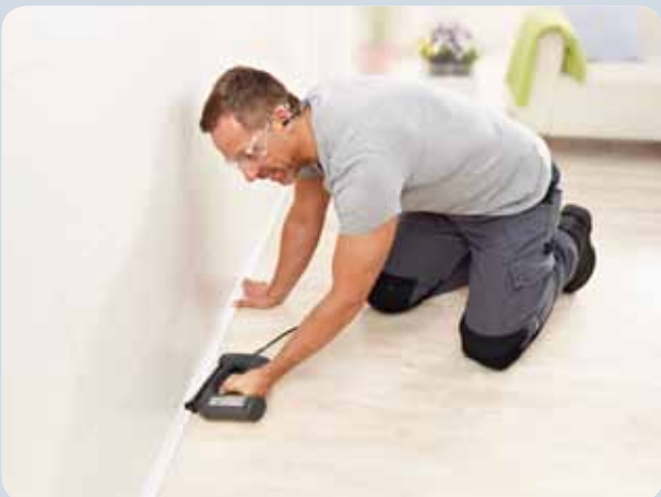
Zierleisten können schnell und einfach getackert werden.