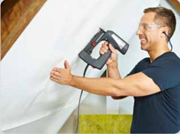
Folie beim Dachbodenausbau einfach befestigen.