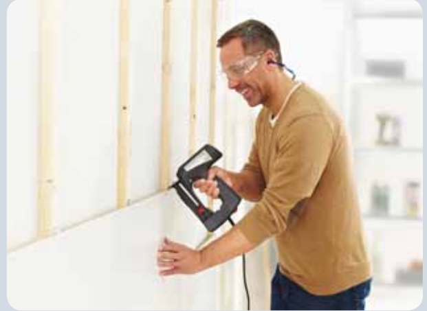
Profilhölzer mit Profilholzkralen befestigen.