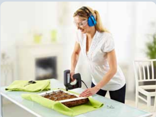
Einfaches Befestigen vom Stoffen beim Polstern.